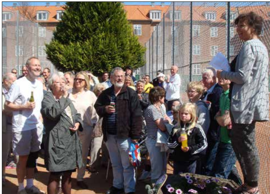
Formandens tale ved standerhejsningen 2012

Reserver allerede nu dagen. Mere information på hjemmesiden og i et nyhedsbrev.