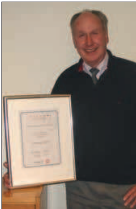
Årets tennisleder 2003, uddelt af Dansk Tennis Forbund .

For første gang i klubbens historie lånte klubben midler for at kunne betale for de 2 baner. Sidste afdrag til Arbejdernes Lands-