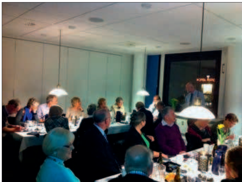
Klubbens ældre medlemmer hygger sig

Vi takker Banken på det hjerteligste for en oplysende og hyggelig aften.