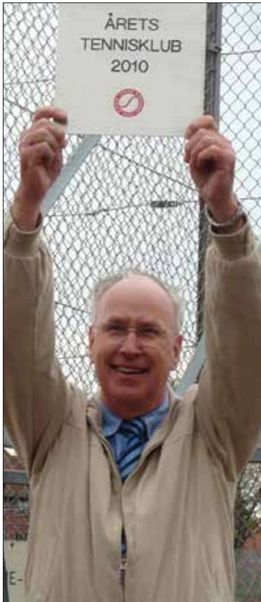
Den stolte formand

I min indledning i 2009 skrev jeg følgende: "Vi er nu rykket ind i 2010 og kan se frem til en forhåbentlig dejlig sæson på Genforeningspladsen."