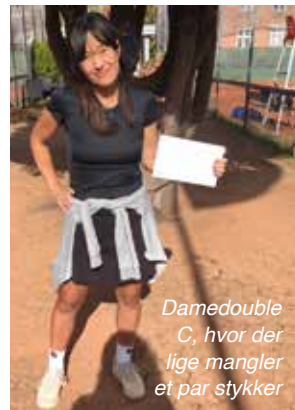
Damedouble C, hvor der lige mangler et par stykker