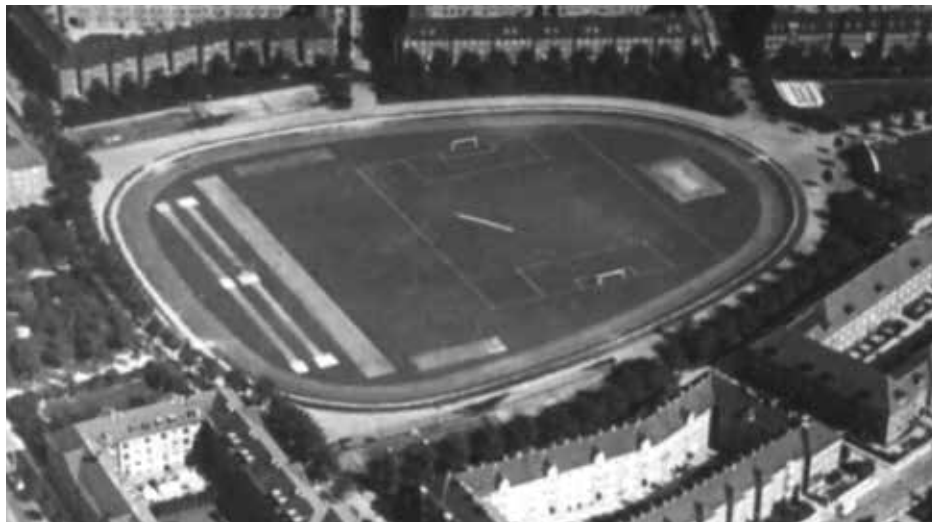
Genforeningspladsen ca 1930. 2 tennisbaner på hver side og fodboldbanen på tværs

Velkommen til udendørs sæsonen 2018 på Genforeningspladsen.